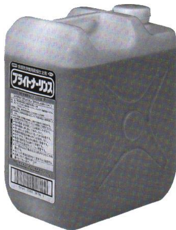
〈荷姿〉 10kg ポリ容器