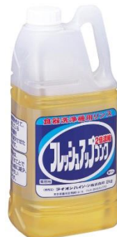
【荷姿】 4kg・段ボール入 (2kg減容容器×2)

* 適正使用濃度は、使用条件によって異なります。濃度設定は当社技術員にお任せ下さい。